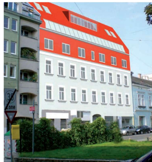
Nach der Sanierung